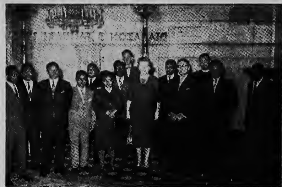
Na su palacio na Soestdijk Su Mahestad La Reina Juliana a ricibi un delegacion di Consejo di Nieuw Guinea cu actualmente ta haci un bishita di orientacion na Hulanda.